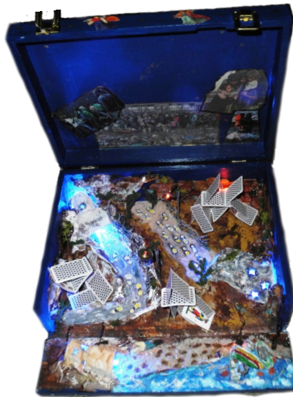
Sandra Coluccia - I passi della speranza